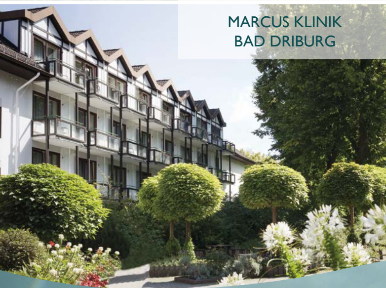
MARCUS KLINIK BAD DRIBURG