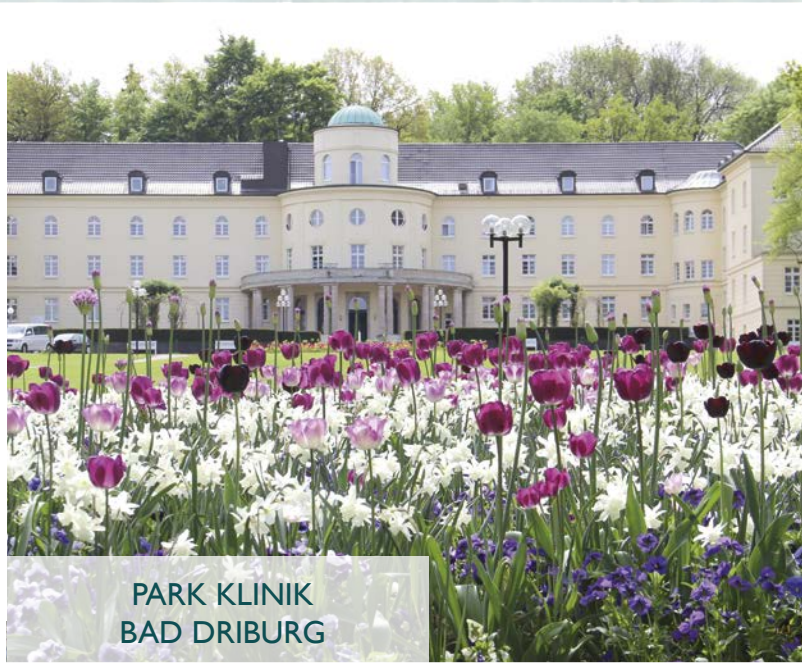
PARK KLINIK BAD DRIBURG