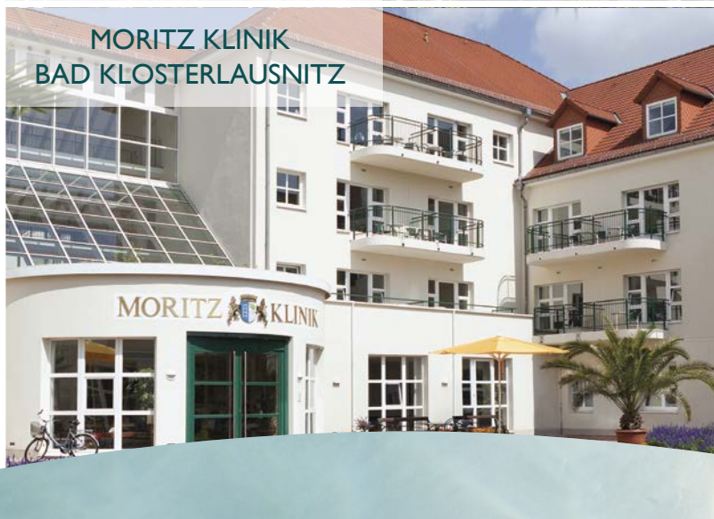
MORITZ KLINIK BAD KLOSTERLAUSNITZ