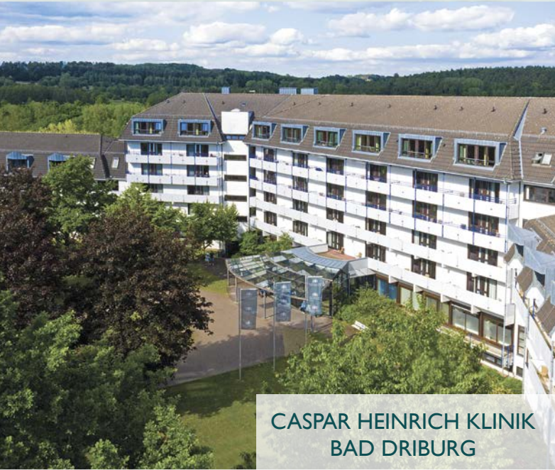
CASPAR HEINRICH KLINIK BAD DRIBURG